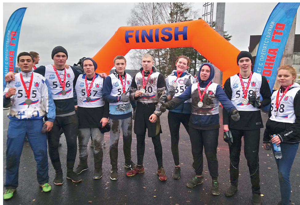
Команда Петровского колледжа. Гонка ГТО «Путь Единства»